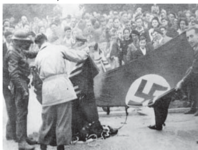
Fête de la Libération à Niort, la foule brûle le drapeau nazi, Place de la Brèche, septembre 1944