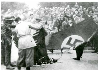
Fête de la Libération à Niort, la foule brûle le drapeau nazi, Place de la Brèche, septembre 1944