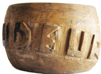
Rond de serviette fabriqué par un interné du camp d'internement de Vaudeurs.