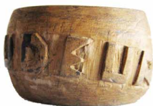
Rond de serviette fabriqué par un interné du camp d'internement de Vaudeurs.